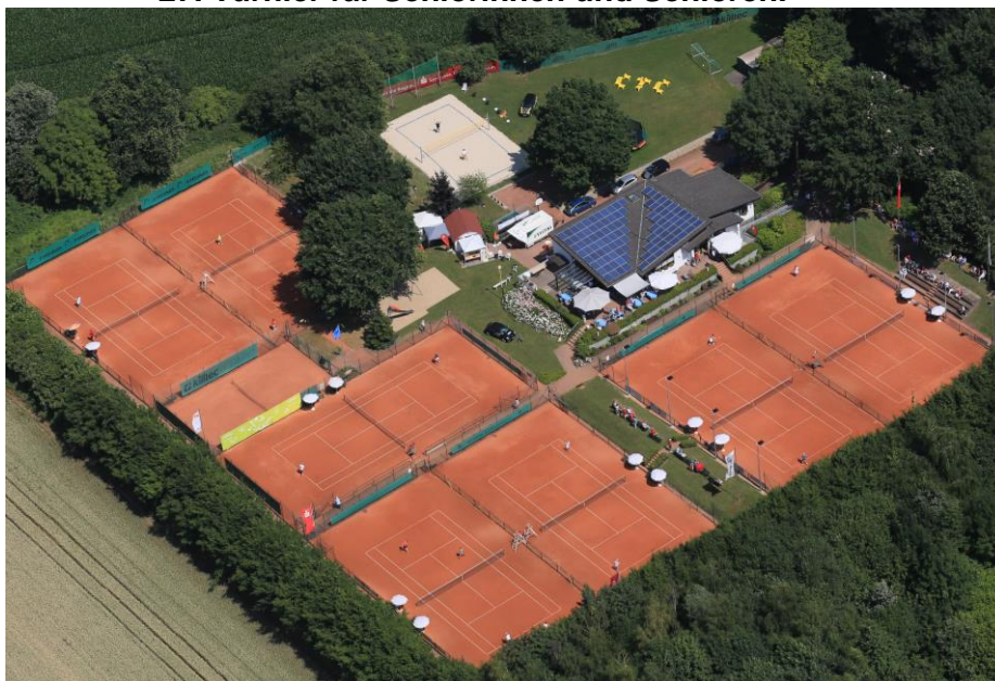
Die schöne Tennisanlage des CTC

Liebe Tennisfreunde, herzlich willkommen in der Samt- und Seidenstadt zum 27. Turnier für Seniorinnen und Senioren.